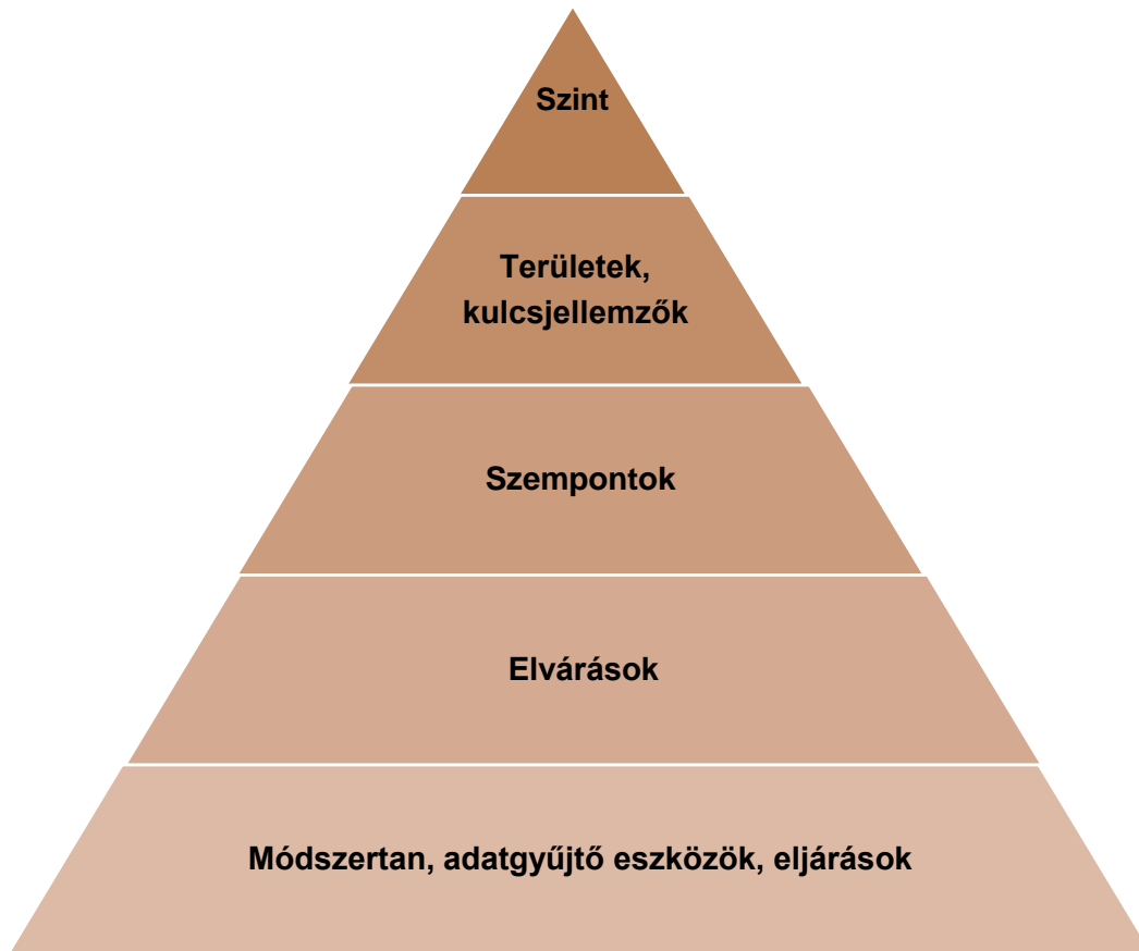
2. sz. ábra. Az önértékelési standard szerkezete