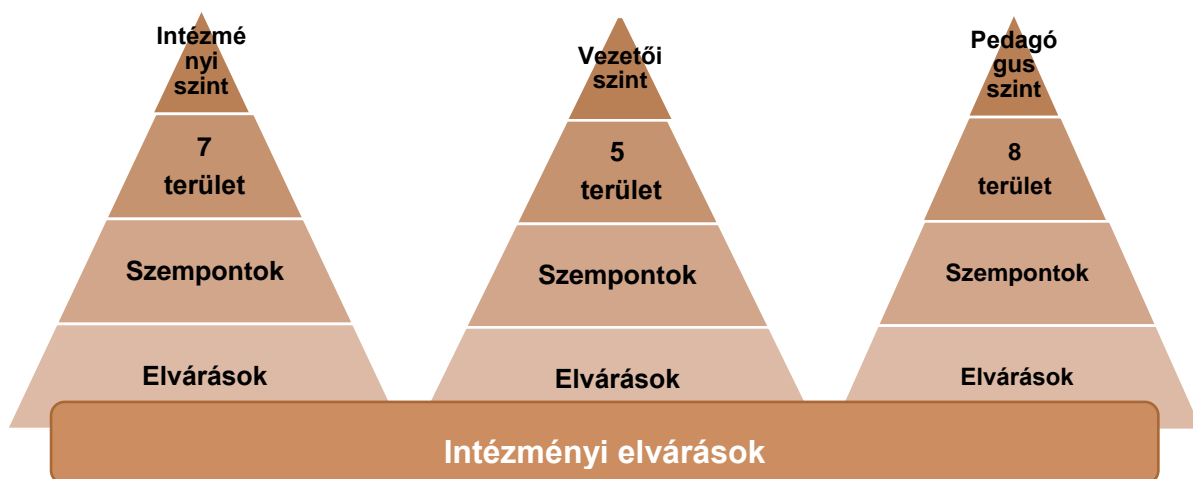
3. sz. ábra. A standard elvárásainak és az intézményi elvárások viszonya