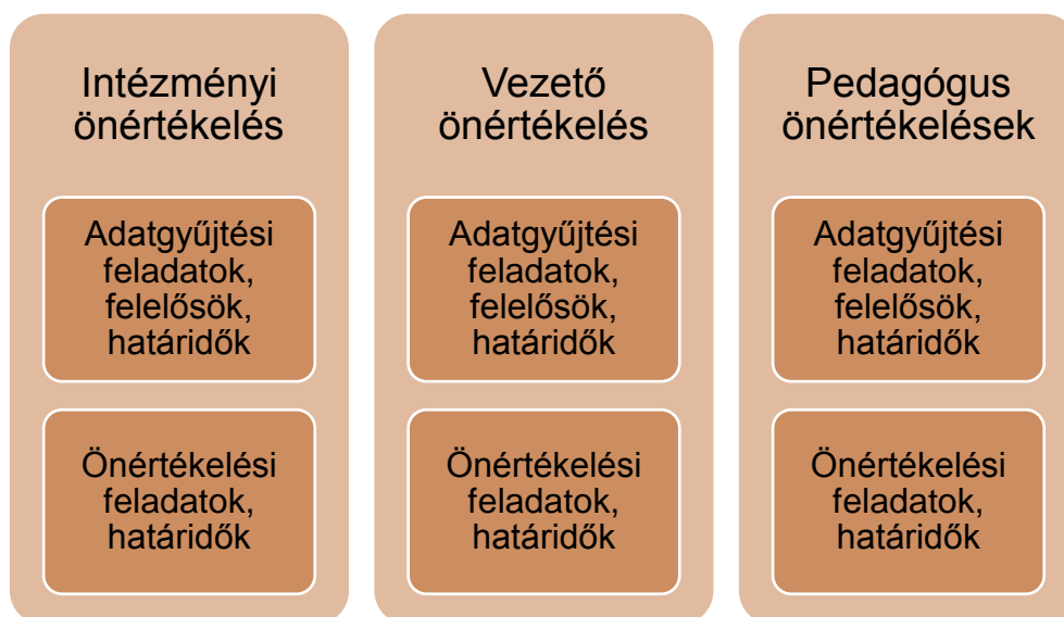
5. sz. ábra. Az éves önértékelési terv ajánlott szerkezete

Az önértékelési programot és az éves önértékelési tervet az intézményvezető vagy az önértékelési csoport erre kijelölt tagja rögzíti az Oktatási Hivatal által működtetett informatikai felületen, amely a tervben rögzítettnek megfelelően teszi elérhetővé az adatgyűjtő és az értékelő funkciókat az értékelésben részt vevők számára.